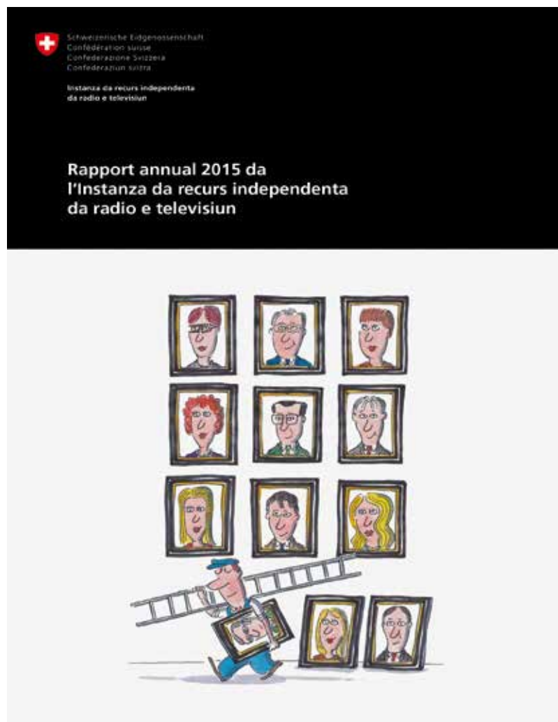
Sisum: ils 9 commembers da l'Instanza en la nova cumposiziun – giudim: ils trais commembers extrads pervia da la limitaziun dal temp d'uffizi

Tar trais proceduras ha l'Instanza da recurs constatà ina violaziun da la concessiun, quai vul dir che las contribuziuns n'èn betg stadas objectivas. Sancziunà ha l'Instanza ils recurs cunter duas contribuziuns da Radio SRF. L'emissiu da novitads „HeuteMorgen“ ha dà in'impressiun fallada davart las raschuns per las qualas in'interpresa ha bandunà la Svizra. En il rom da la contribuziun pertutgant in'interpresa da telemarketing n'ha il magazin da consumers „Espresso“ betg cumpilà objectivamain in discurs da vendita. Era sco betg objectiva ha l'Instanza taxà ina contribuziun dal magazin da consumers „Kassensturz“ da SRF davart „Tschavattadas da dentists“ (Zahnarztputsch), essend che fatgs impurtants n'èn betg vegnids menziunads.