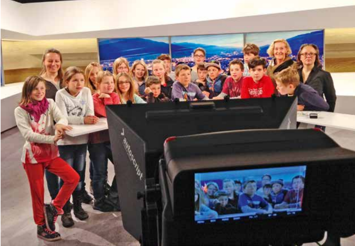
Per las scholaras ed ils scolars da la 3. fin 6. classa da S-chanf è scriver cool.