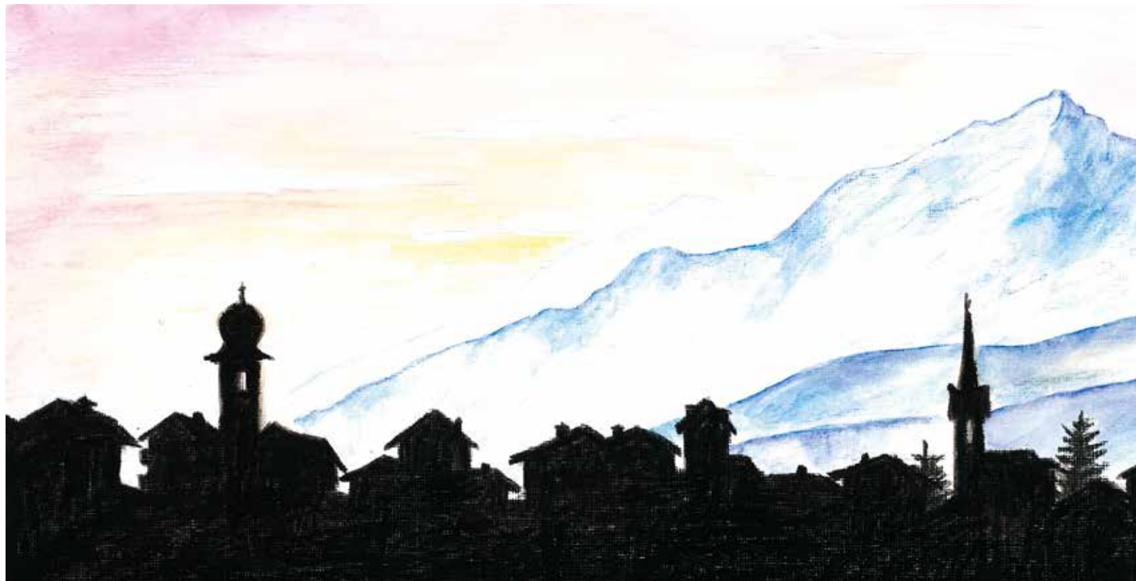
La vischnanca da Surgonda – cun dus clutgers