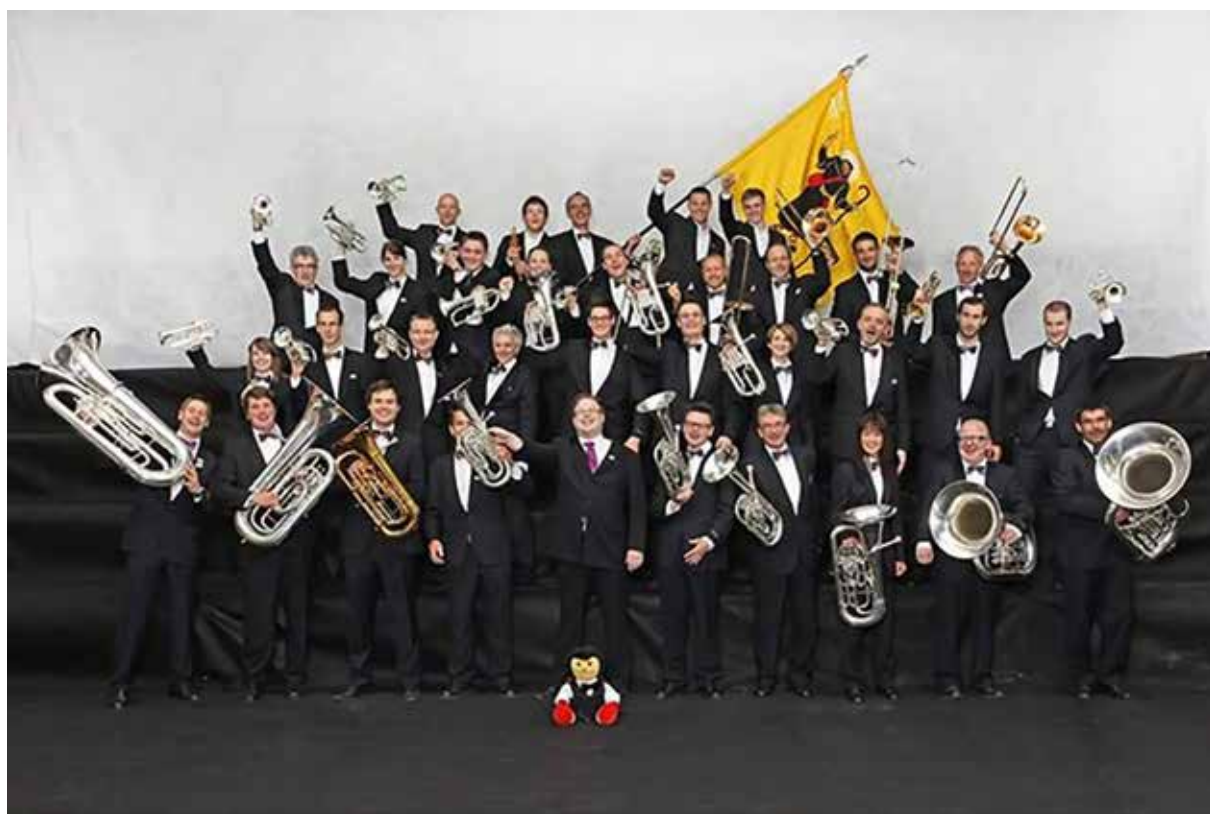
La Televisiun Rumantscha accompogna l'Uniu da musica da Sagogn sin sia via a Montreux.

La medema fin d'emna porscha Lai suttetg a 1'450 musicantAs a chaschun da gist duas festas da musica.